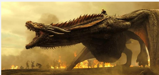
Cena da série Game of Thrones

Curiosamente, a presença do réptil se encontra em diversas culturas de todo o globo terrestre, com relatos de artefatos e pinturas o representando na América pré-colombiana, na Europa, Oceania, Oriente Médio e na Ásia, onde até os dias atuais é uma figura que faz parte do folclore e do entretenimento.